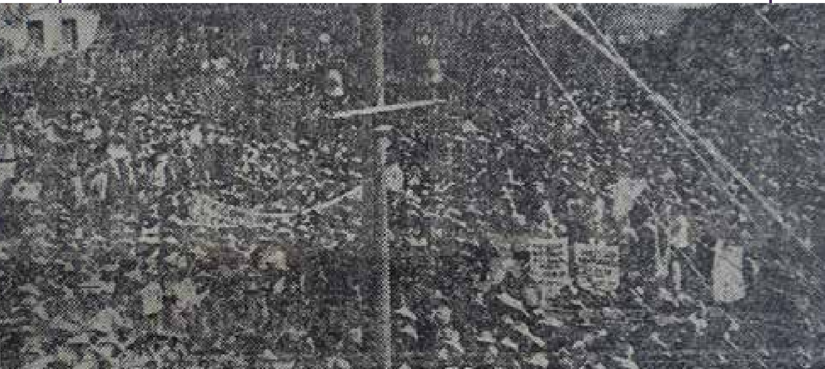
Simpatizantes en la plaza Independencia a la llegada de Álvaro Obregón , Pachuca, Hidalgo , 30 de noviembre de 1919, reproducción Hilario Herrera Tapia , imagen fotomecánica de El Monitor Republicano , 1 de diciembre 1919, p.1.

El discurso que pronunció alude de manera intensa al futuro del pueblo mexicano; asimismo, se hizo un llamado al patriotismo, a ejercer el voto de la manera más democrática, pero sobre todo a no cuestionar las victorias del pueblo, recordando el alzamiento iniciado en 1910.